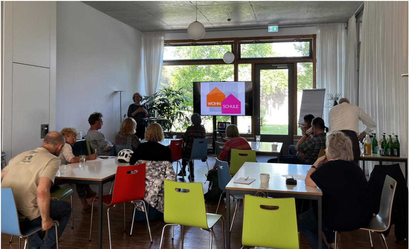
Bild: Infocafé Wohnen im Alter mit der Berliner Wohnschule am 29. April 2025